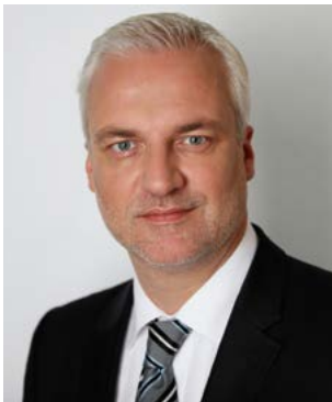
Garrelt Duin, Minister für Wirtschaft, Energie, Industrie, Mittelstand und Handwerk des Landes Nordrhein-Westfalen

Ich lade Sie herzlich dazu ein, diese Angebote zu nutzen.